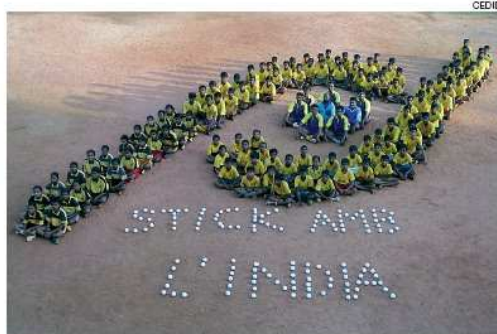
Els participants del campus solidari van dibuixar el logotip d'Stick amb l'Índia'.

campus a un total de 130 nens d'entre 11 i 19 anys. Andreu Enrich destacava «el nivell d'alguns dels nens que formaven part del campus. Molts d'ells ja tenien coneixement de l'esport perquè a deu escoles de la regió ja es practica l'hoquei com a activitat escolar». Un dels aspectes