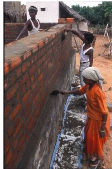
Casa en construcción.

Las colonias de casas construidas están provistas de las condiciones mínimas de salubridad, constituyendo un resguardo eficaz ante las lluvias torrenciales y el calor intenso y, sobre todo, proporcionan un sentimiento de dignidad a una comunidad profundamente discriminada.