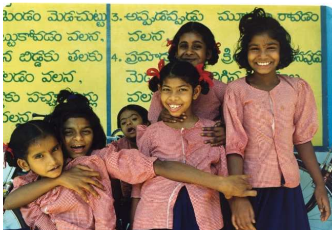
Centro de discapacitados psíquicos en Bathallapalli.

Paralelamente, se han creado asociaciones de discapacitados de apoyo mutuo y gestionadas por los propios miembros que, gracias a un Fondo Común, ponen en marcha talleres u otro tipo de negocios, y actividades que les permiten alcanzar su independencia y al mismo tiempo potencian su integración social.