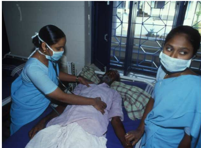
Enfermos hospitalizados.

Desde el inicio de este programa se ha formado a miles de agentes sanitarios locales, preparados para tratar y asesorar sobre temas de prevención y asistencia primaria, constituyendo una red sanitaria básica de gran eficacia y utilidad; se han construido 4 hospitales generales como centros de referencia para la red de asistencia primaria; un centro de planificación familiar; un centro de tratamiento y atención a enfermos de sida, además de pozos, canalizaciones de aguas y otras instalaciones para evitar infecciones.