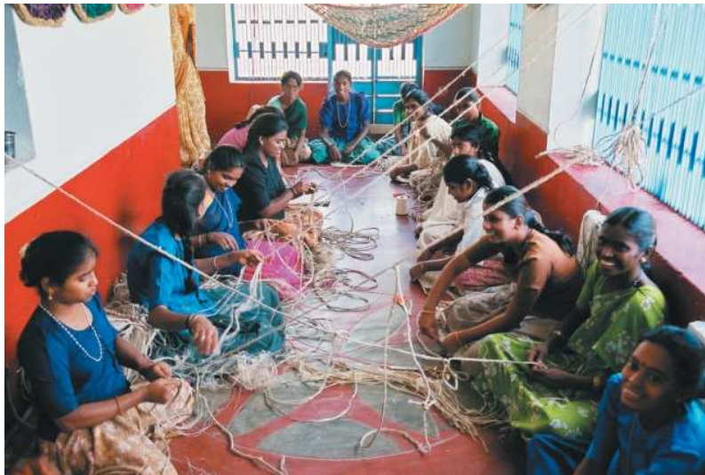
Taller de Yute.