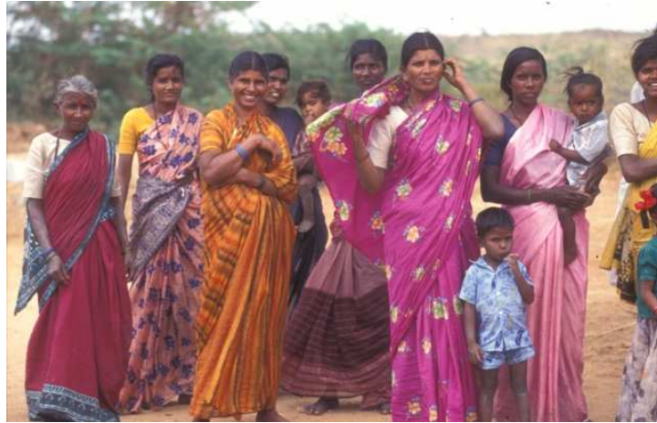
Grupo de mujeres.

También a través de los shangams las mujeres adquieren conciencia de sus derechos y reconocimiento por parte de la sociedad.